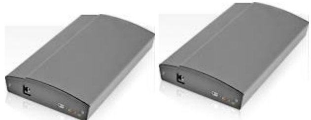
Abb.: Zwei professionelle Video-Grabber für Horizontal- und Vertikalradar, die zur Bildaufnahme verwendet werden.

Die Radar-Software kann auf jedem aktuellen Windows-PC oder Laptop installiert werden, wird aber bei Bedarf auch komplett konfiguriert ausgeliefert. Die Video-Grabber-Boxen, die an das Radargerät angeschlossen werden, sind für verschiedene Eingänge spezifiziert (VGA, HDMI, DVI). Alternativ kann der Radarbildschirm mit Hilfe einer Videokamera aufgenommen werden.